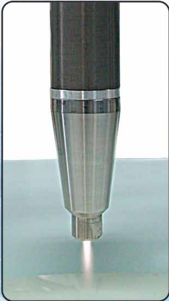
Bico de Plasma